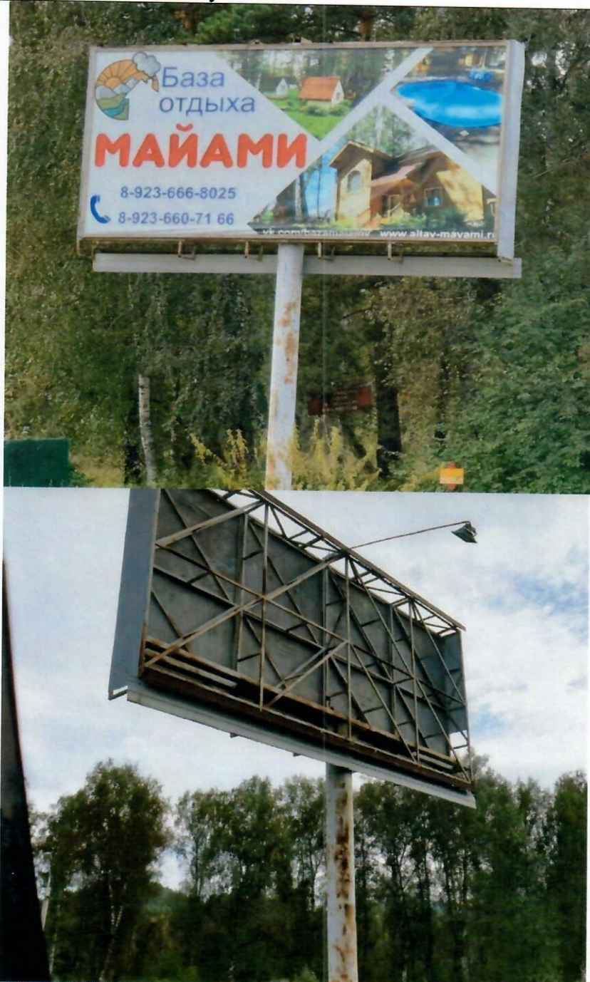
Фото рекламной конструкции

«5» сентября 2024 года отделом архитектуры и градостроительства Администрации муниципального образования «Майминский район» выявлена рекламная конструкция, установленная и (или) эксплуатируемая без разрешения, срок действия которого не истек, установленного по адресу (в случае отсутствия технической возможности определить точное местоположение, указывается ориентировочное расположение): 457км.+985м. трассы М-52 «Чуйский тракт» (справа) в границах неразграниченного земельного участка.